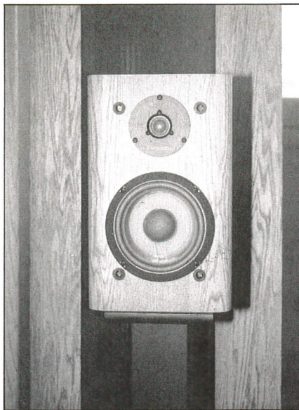
La piccola RS 2000 posa davanti all'enorme sorella maggiore RS 1B.

prospettica riprodotta con estrema correttezza, molto ariosa, al cui interno è facile distinguere e leggere i vari elementi. La dinamica generale non può essere definita entusiasmante, le 2000, come detto non sono casse che amano impressionare con le cannonate della 1812, o suonare a volumi fisiologicamente pericolosi, ma il contrasto è invece molto buono e di ciò si avvalgono